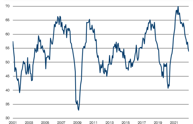
Abb. 1: Industrie-PMI weiter in Wachstumszone Wachstumsschwelle = 50