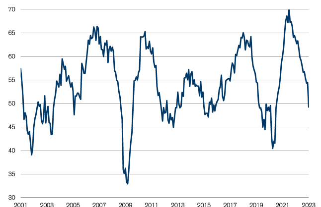
Abb. 1: Industrie-PMI gibt deutlich nach Wachstumsschwelle = 50